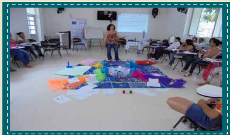
Quinta sesión diplomado Putumayo.

Con la participación de 102 mujeres, 50 en Cauca y 52 en Putumayo se finalizó la 5 sesión del diplomado, dando por concluido este proceso con las mujeres; el cual tendrá acto protocolario de graduación el próximo 14 de noviembre en la Ciudad de Cauca - Popayán, donde la Universidad del Cauca se encargará de certificar a las mujeres – estudiantes, reafirmando una vez más su compromiso con ellas y con la construcción de la paz, estable y duradera para el Cauca y Putumayo.