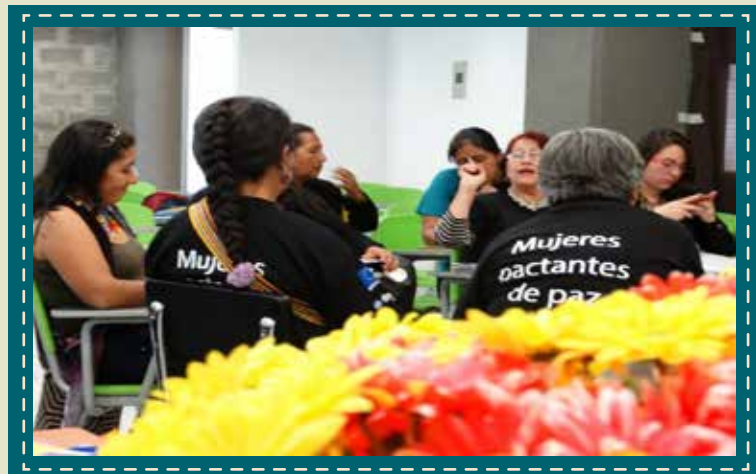
Quinta sesión diplomado Cauca.

Con la participación de 102 mujeres, 50 en Cauca y 52 en Putumayo se finalizó la 5 sesión del diplomado, dando por concluido este proceso con las mujeres; el cual tendrá acto protocolario de graduación el próximo 14 de noviembre en la Ciudad de Cauca - Popayán, donde la Universidad del Cauca se encargará de certificar a las mujeres – estudiantes, reafirmando una vez más su compromiso con ellas y con la construcción de la paz, estable y duradera para el Cauca y Putumayo.