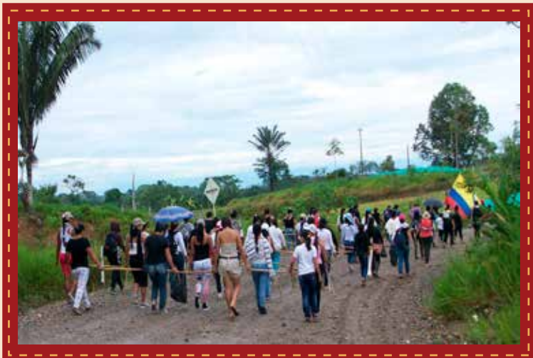
Acción por la paz. Plantón por el derecho a la vida.

Las mujeres del proyecto "Mujeres Pactantes de Paz" y otras mujeres de organizaciones se solidarizan con la comunidad en general, uniéndose para realizar una marcha de resistencia con el fin de exigir el cese de las violencias en su territorio. Este plantón tuvo lugar el viernes 15 de septiembre donde se movilizaron 300 mujeres por el corredor de Puerto Vega - Teteyé hasta Puerto Asís, allí se expuso un pliego de exigencias ante delegación del Gobierno nacional que se encontraba en la ciudad; las mujeres actualmente continúan a la espera de que éstas sean puestas en consideración y que se dé pronta respuesta.