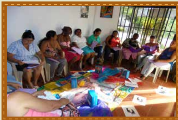
Taller de Devolución en Puerto Asís - Putumayo .

En Puerto Asís - Putumayo se realizó taller de Devolución de la Comisión de la Verdad y Memoria de las Mujeres víctimas del conflicto armado a 70 mujeres testimoniante. Este espacio permitió que las mujeres compartieran algunas experiencias nuevas, conocieran la incidencia que ha tenido la Comisión y como está se ha convertido en un aporte para la construcción