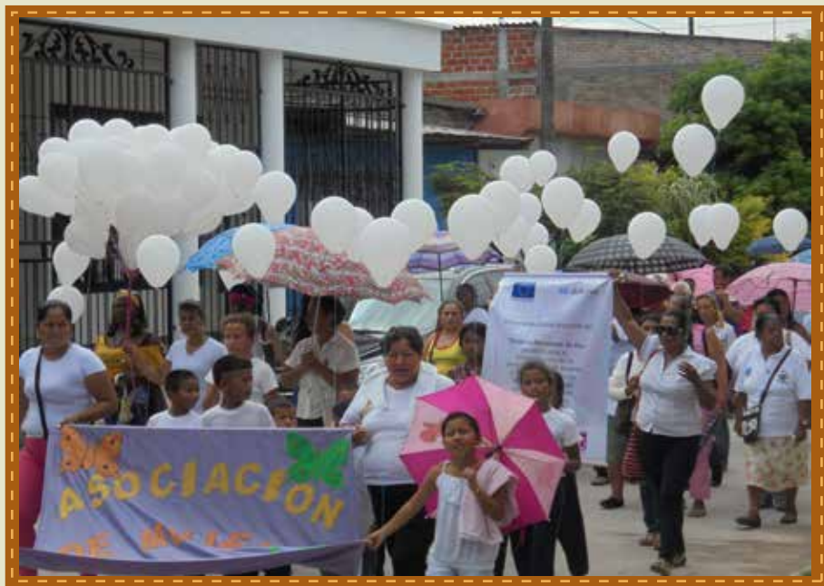
Acción por la Paz. Mujeres marcharon para que cese la violación de los DDHH en Putumayo.

Sin embargo, lo que se está acordando en la Habana no son capitulaciones, es la deuda histórica que el Estado y los gobiernos, uno tras otro han adeudado a los territorios, las regiones, sus habitantes, los diversos sectores y organizaciones que lo residen. Por ello, decididamente apoyamos la negociación y el acuerdo de paz y lo que de allí se derive.