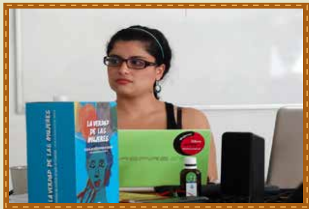
Socialización de la Comisión en Santander de Quilichao

En Santander de Quilichao – Cauca se realizó foro de socialización de la Comisión de la Verdad y Memoria ante 70 personas, entre las que se encontraban representantes de organizaciones de mujeres y representantes de instituciones públicas, el evento tuvo lugar el 2 julio de 2014.